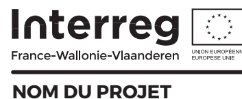
VERSION EN NOIR & BLANC