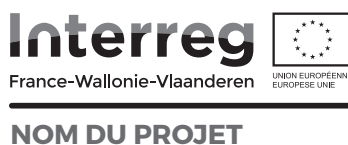
VERSION EN NIVEAU DE GRIS